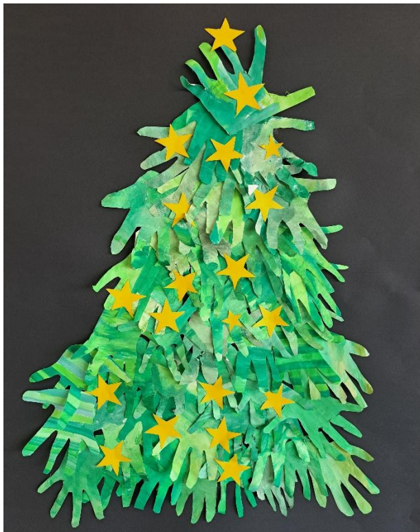
Gemeinschaftsarbeit der Klasse 2a

Weihnachten ist kein Zeitpunkt und keine Jahreszeit, sondern eine Gefühlslage.